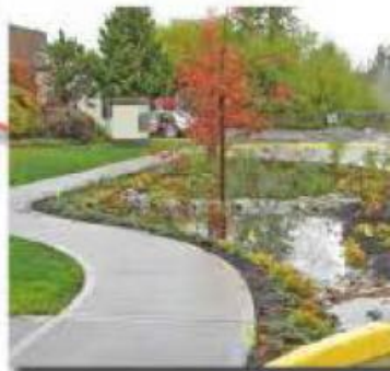
Rain Garden water pollution