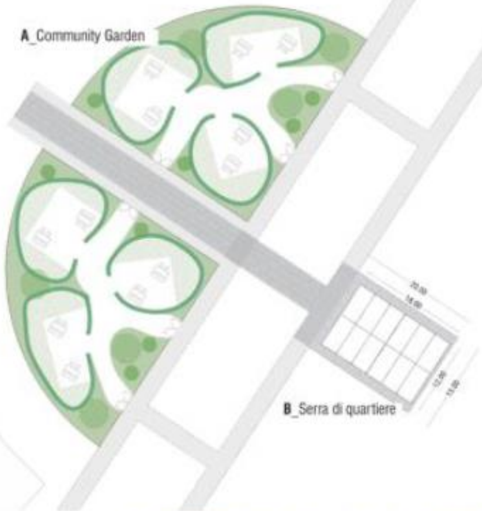
B_Serra di quartiere